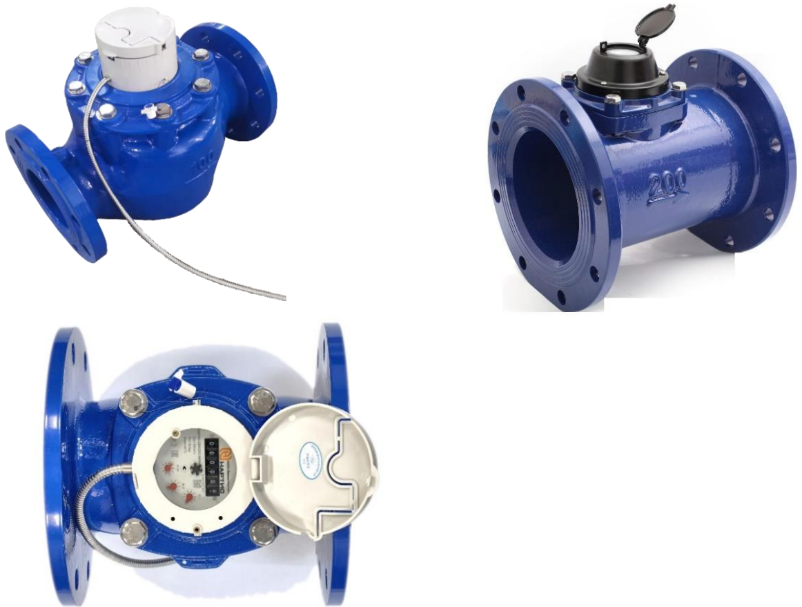
Рисунок 2 – Внешний вид счетчика НАРТИС-СВИ

2.4.1 Счетчик состоит из корпуса, входных и выходных патрубков с фланцами для подключения к трубопроводу (проточной части), турбины и счетного устройства с индикатором, соединенных между собой. Общий вид счетчика представлен на рисунке 2.