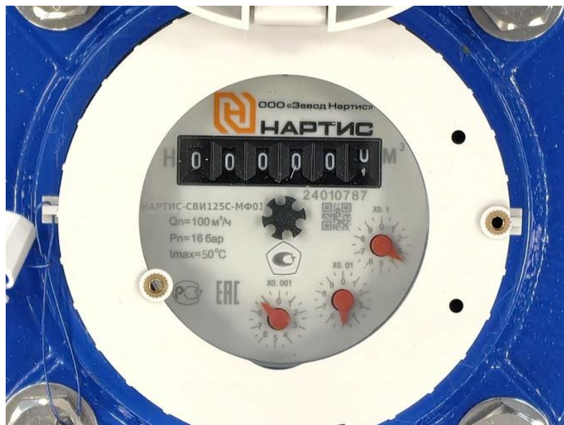
Рисунок 1 – Индикаторное устройство счетчика НАРТИС-СВИ

Индикаторное устройство счетчика осуществляет индикацию показаний объема воды, прошедшего через счетчик.