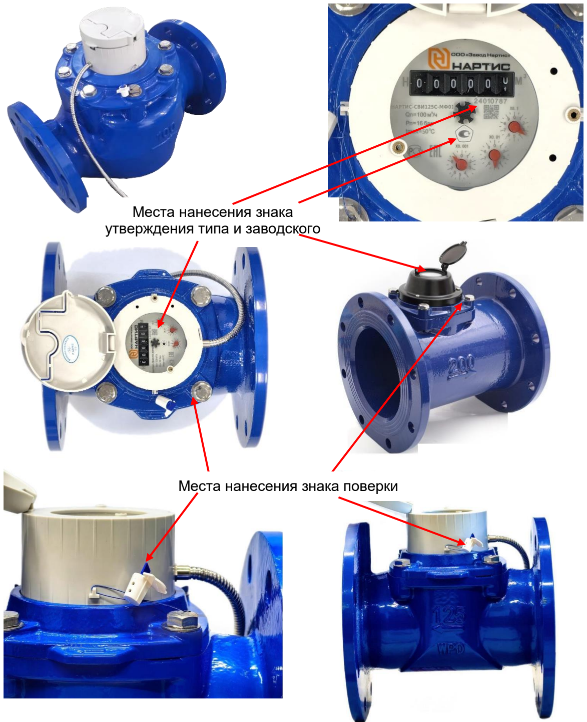
Рисунок 3 – Общий вид счетчика с указанием мест нанесения заводского номера, знака поверки и знака утверждения типа