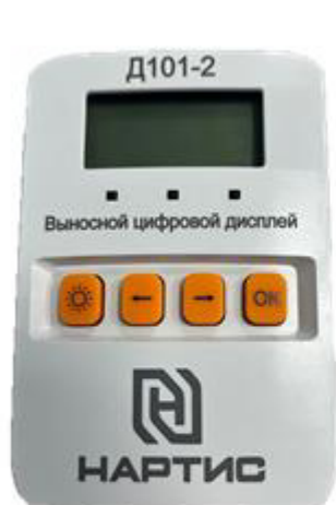
д) выносной цифровой дисплей НАРТИС-Д101-2