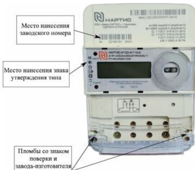
е) счетчики с типом корпуса W112