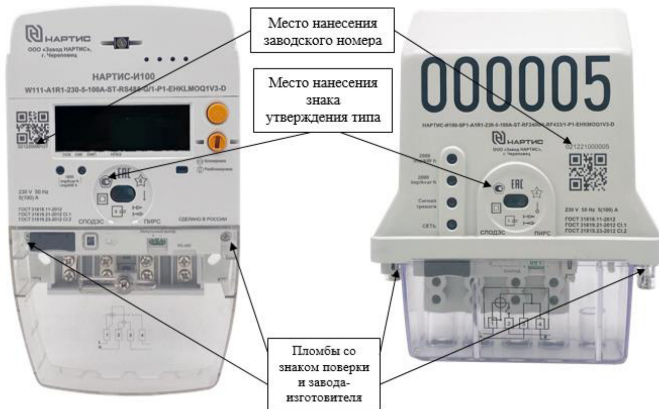
а) счетчики с типом корпуса W111

Общий вид счетчиков с указанием места ограничения доступа к местам настройки (регулировки), места нанесения знака утверждения типа, места нанесения заводского номера представлен на рисунке 1. Способ ограничения доступа к местам настройки (регулировки) – пломба с нанесением знака поверки.