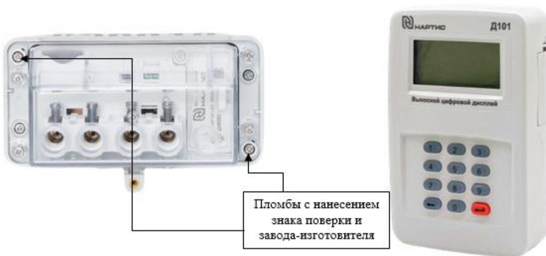
в) клеммная колодка счетчиков с типом корпуса SP1